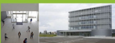
フード&メディカルイノベーション国際拠点ってこんなところ

FMIでは産・学・地域の協働により、研究者や企業、市民の皆様との対話を通じて食・運動・健康・医療の連携によるイノベーション創出に向けた研究開発事業の推進及び支援を行っています。